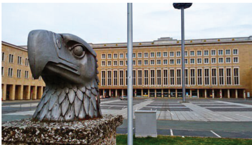
Рис. 3. Будівля аеропорту Темпельхоф

соціалізму», яке вплетене в структуру зв'язків сучасного дискурсу Берліна.