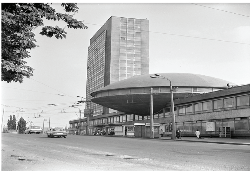
Рис. 1. Будівля УКРІНТЕІ

Сьогодні будівля «Квіти України» є предметом дискусій щодо її збереження та подальшого використання. Її архітектурна цінність полягає не лише в її оригінальній формі, але й у відображенні еволюції архітектурного модернізму в Україні та її унікальній адаптації до специфічного функціонального призначення точки зору історичного контексту. Будівництво відбувалося в період розвитку пізнього модернізму, коли відбувалося певне