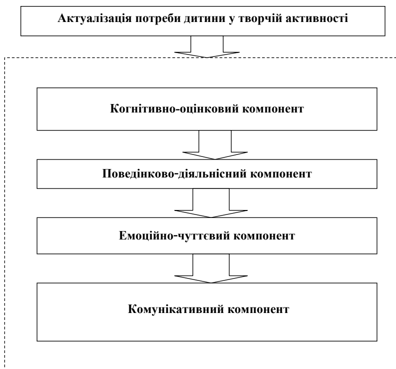
Рис. 2. Комплексна технологія засвоєння освітнього простору